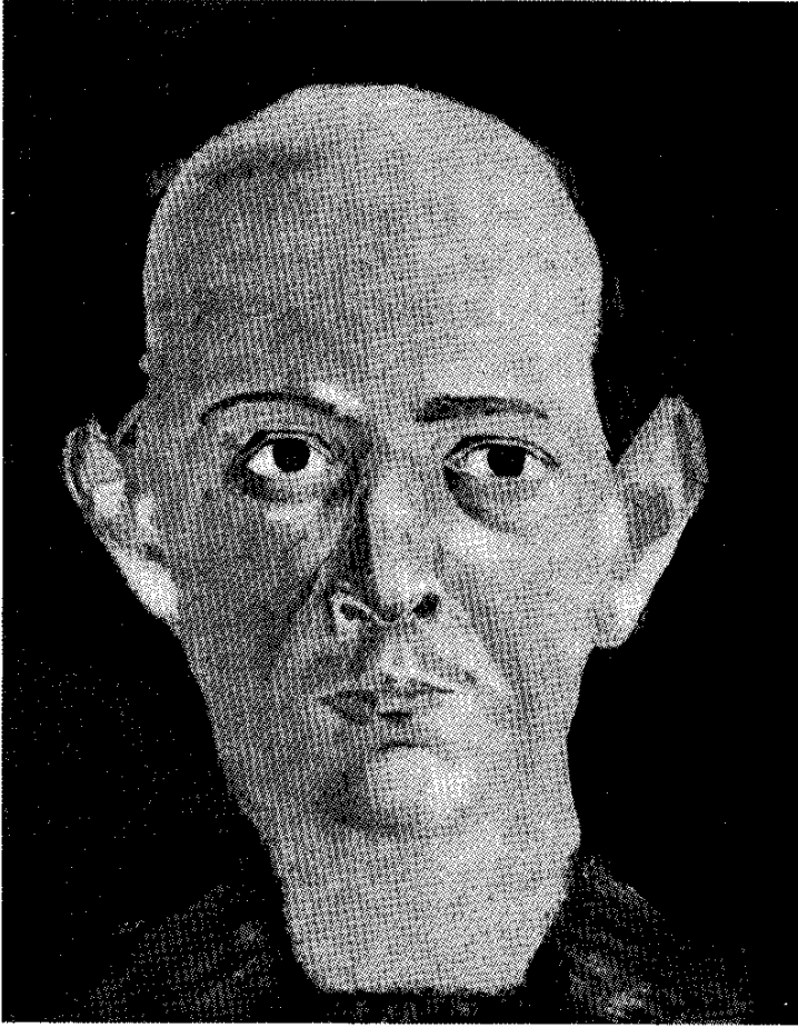
Arnold Schönberg: Selbstbildnis