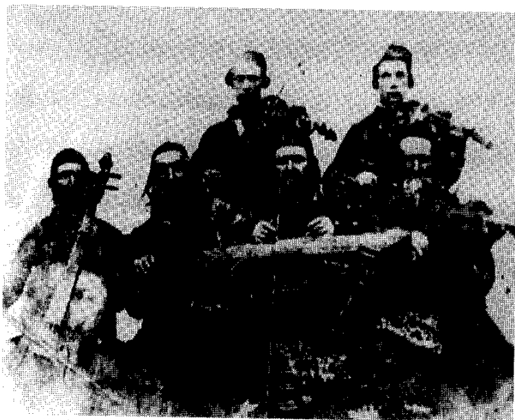
Gruppenportrait eine Klezmer-Kapelle (Polen, 1905)