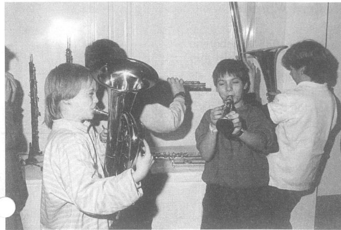
Das klingende Museum in der Hamburger Musikhalle